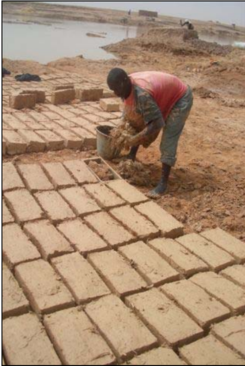
Banco fortifié: traditionnel et écologique