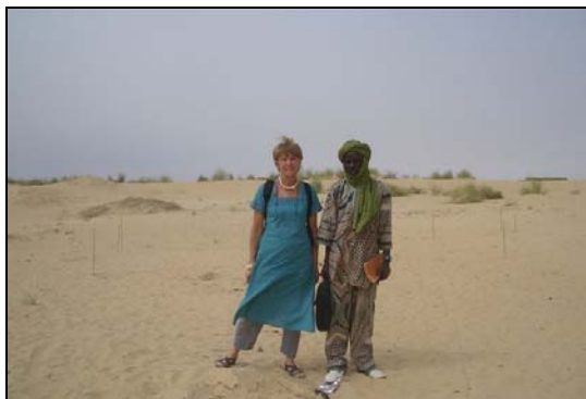
Februari 2009: terrein wordt afgebakend

In Medina Koura (het Biya schooltje op 5 km van Mopti) hebben ze het vorig jaar meegemaakt . Er werden verbeteringen gedaan aan het gehuurde “school-huis” . Maar, in september werd de huur plots opgetrokken met maar liefst 100%: van 25.000 CFA tot 45.000 CFA per maand!!! Ze zijn meteen verhuisd naar een ander erf , en moeten daar nu opnieuw bijbouwen, dak repareren, toiletten (latrines) zetten ,edm..